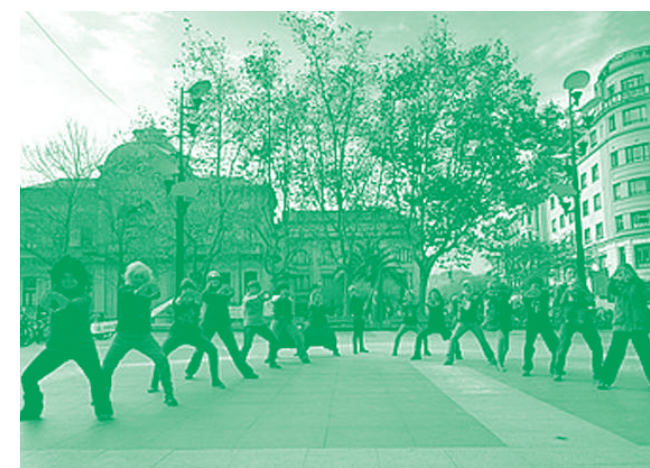
Atzo Donostian egindako aerobitoia / EMAKUMEEN MUNDU MARTXA